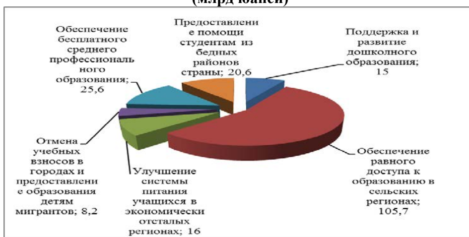
Расходные статьи бюджета КНР в 2012 г. (млрд юаней)

Составлено по: «2012 nian zhongyang caizheng jiaoyu zhichu anpai 3781,32 yi yuan (В 2012 г. расходы центрального бюджета на образование должны составить 378,1 млрд юаней). - «Jiaoyu Wang» (Газета «Новости образования в КНР»).